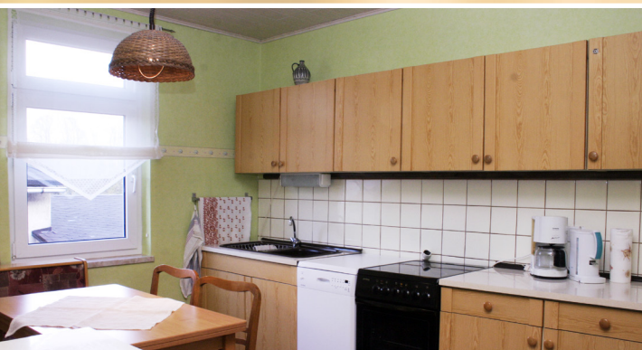
Küche mit Sitzecke, Kühl-/Gefrierkombination, Geschirrspüler, Elektroherd mit Backofen/Grill.