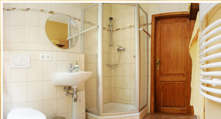
Dusche, WC, Fön. Alle Räume mit Zentralheizung.

Bettwäsche wird gestellt und wöchentlich gewechselt. Mindestens 2 Übernachtungen.