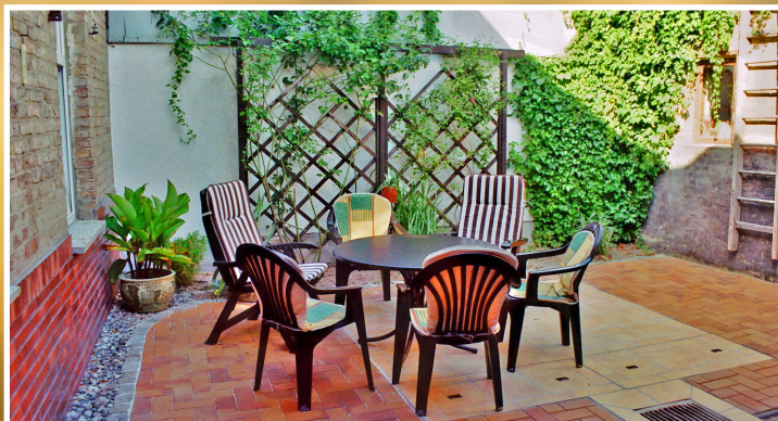
Begrünter Innenhof, teilweise überdacht. Garten mit Liegewiese, Gartenmöbeln und Grill.