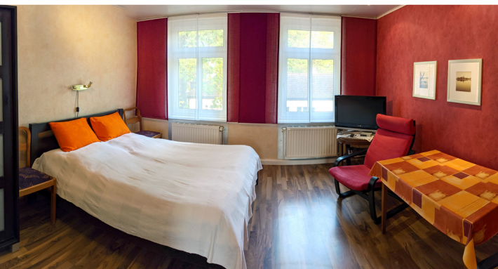
Wohnung in der ersten Etage ca. 50 m 2 . Zusätzliches Wohn-/Schlafzimmer 18 m 2 im Erdgeschoss. Doppelbett bzw. zwei Einzelbetten, SAT-TV